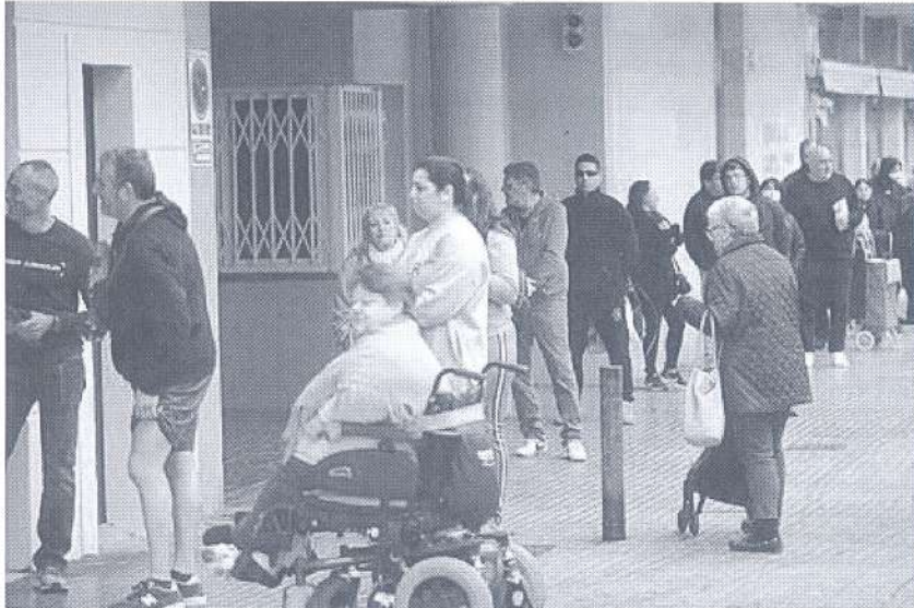
Gente en la entrada de un supermercado de Palma durante el estado de alarma.

Actualizado Lunes, 30 marzo 2020 - 11:48